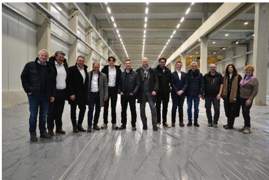
Bild 4: Die Geschäftsführung, das Projektteam und die Gesellschafter von Beko Technologies freuen sich auf die neue Produktionshalle.