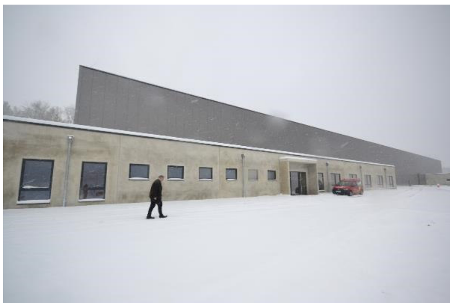
Bild 1: Die neue Produktionsstätte von Beko Technologies in Netphen